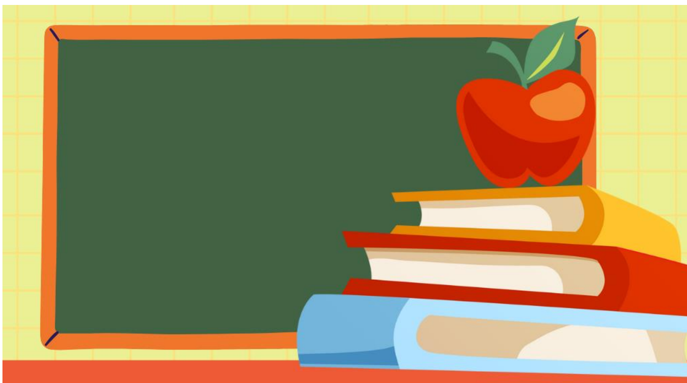
Imagine gratuită pe Canva